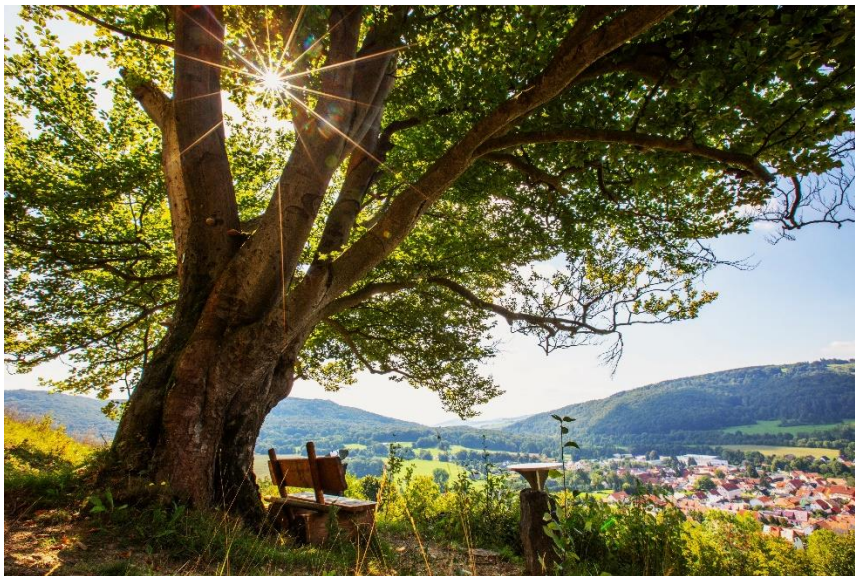
Abbildung 1: Rastplatz am Hexenpfad

Die Publikumswahl beginnt offiziell am 12.01.2024 um 0 Uhr. Die Online-Abstimmung ist unter dem Link www.wandermagazin.de/wahlstudio möglich.